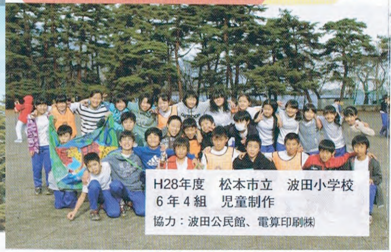
H28年度 松本市立 波田小学校 6年4組 児童制作 協力：波田公民館、電算印刷株式会社

交通案内 ○車でお越しの方は… 長野自動車道松本I.C.を下り、国道158号線を上高地方面へお越し下さい！ ○電車でお越しの方は… 松本駅から「松本電鉄上高地線」に乗ってお越し下さい！ ☆渚の電車も、ぜひ発見してみてください！